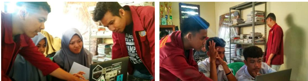
Gambar 3. Fotokegiatan pendampingan penggunaan Teknologi internet untuk promosi Desa Bandungbaru

Kegiatan Sosialisasi dilakukan oleh Tim Pkm pada perangkat Desa Bandungbaru dengan menggunakan media Laptop, Smart Phone dan jaringan internet. Dalam kegiatan ini melibatkan mahasiswa sebagai Tutor pendamping. Untuk lebih jelasnya dapat dilihat pada foto dokumentasi kegiatan berikut ini: